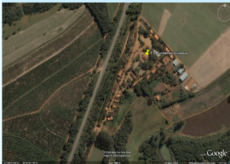
Foto Google da área construída